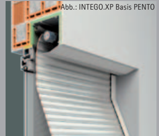
INTEGO.XP Vakolható redőnytok