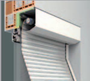
PENTO.XP 5 szögletű tok