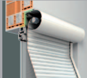
RONDO.XP Lekerekített tok